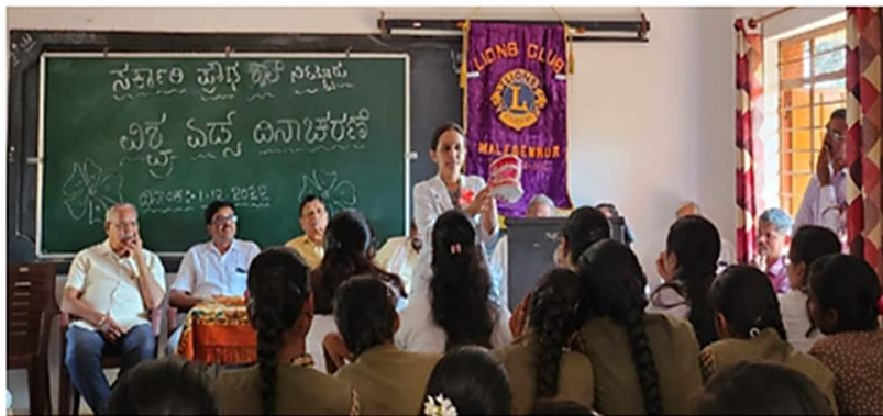
Creating oral health awareness by health talk using charts and dentoform model