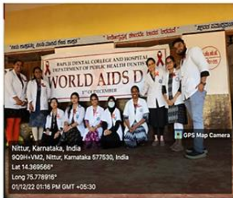
Wearing Red ribbon in support of people suffering from HIV