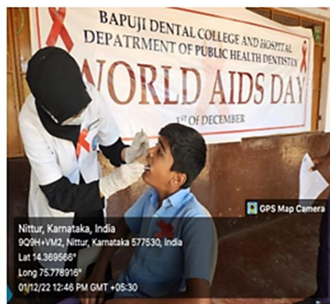
Oral health screening and referral services