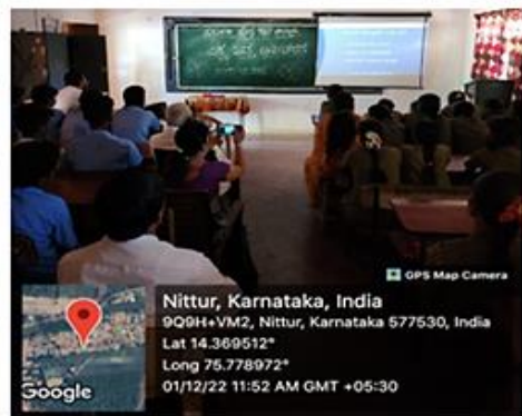
Creating AIDS awareness through display of educational film on AIDS