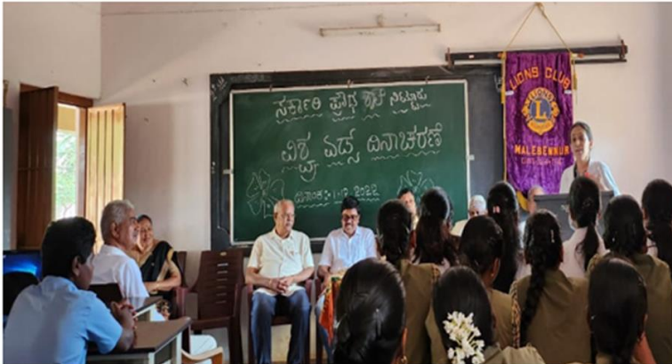
Health talk on AIDS and its prevention